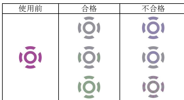
表 2. インジケータ色調